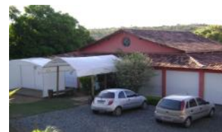
Fazenda Casa Grande

O programa da TFCA apresenta um conteúdo abrangente e o método utilizado é o da experimentação, com aplicação imediata.