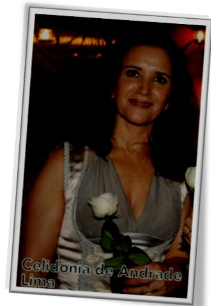
Aluna da TFCA - Técnica Física para a Conquista da Autoconsciência

O maior sofrimento que nos aflige é a morte. E, se nos causa tanto mal, não pode ser uma coisa natural. Nesse momento, então, começamos a questionar a nossa existência. Isso nos leva a uma série de perguntas sem que alcancemos respostas a esse lampejo de consciência que a ideia da morte nos traz.