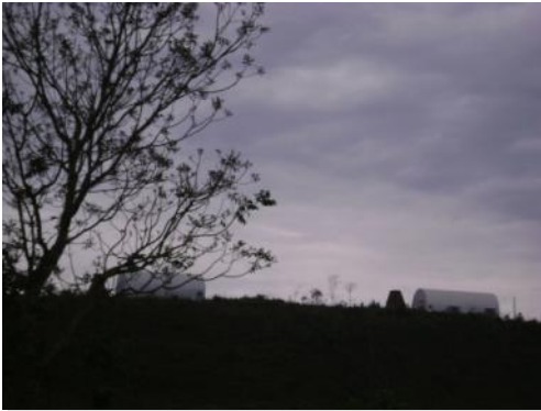
Chalés - Salas de Aula