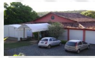
Fazenda Casa Grande

O programa da TFCA apresenta um conteúdo abrangente e o método utilizado é o da experimentação, com aplicação imediata.