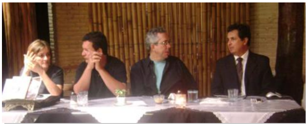
Mesa de Representação do Mundo Físico