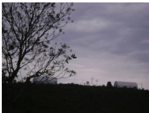
Chalés - Salas de Aula