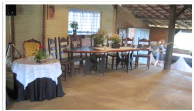
Centro de Saúde - Fazenda Maik-Buz