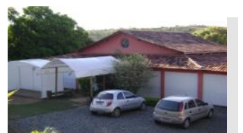
Fazenda Casa Grande