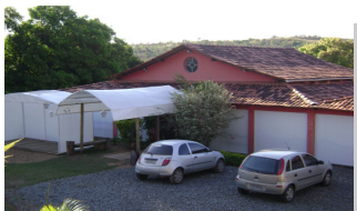
Fazenda Casa Grande

O programa da TFCA apresenta um conteúdo abrangente e o método utilizado é o da experimentação, com aplicação imediata.