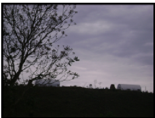
Chalés - Salas de Aula