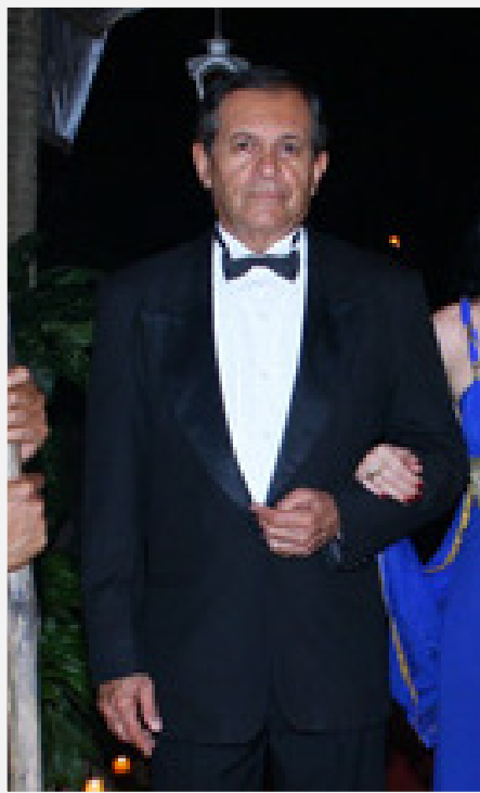
Aluno da TFCA - Técnica Física para a Conquista da Autoconsciência

Muitos grupos buscam a autoconsciência, de uma forma ou de outra, porque acreditam em algo além do que vivenciam.