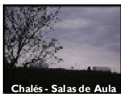
Chalés - Salas de Aula